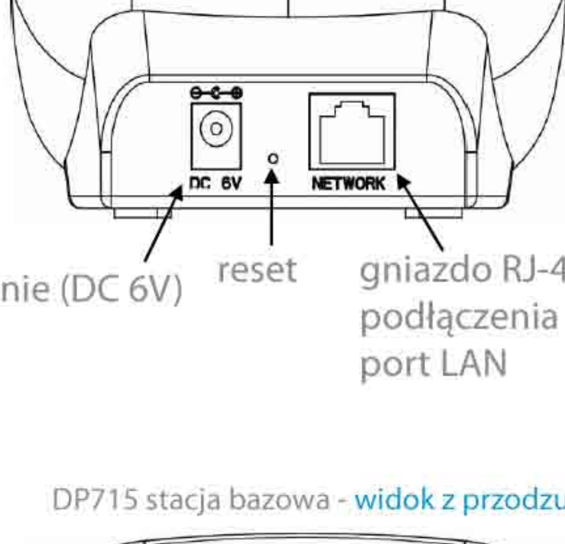
DP715 stacja bazowa - widok z tyłu

zasilanie (DC 6V) reset gniazdo RJ-45 (ETHERNET) do podłączenia z routerem w wolny port LAN